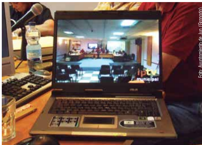
El Código contempla la irrupción de las Tecnologías de la Comunicación en el comportamiento de la Administración.

Por último, el Código abre la posibilidad de que se adhieran a sus objetivos la totalidad de los empleados públicos locales, así como aquellos sujetos proveedores de servicios a la Administración Local y perceptores de fondos públicos.