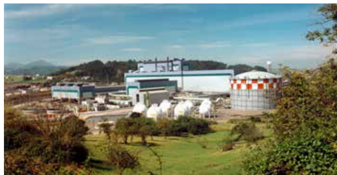
Se han planteado medidas para facilitar el cumplimiento de las obligaciones tributarias de las distribuidoras y comercializadoras de gas

En la exposición de motivos se añade que en relación con los rendimientos derivados de las figuras tributarias establecidas se deberán adoptar los criterios oportunos para que los mismos reviertan con especial intensidad