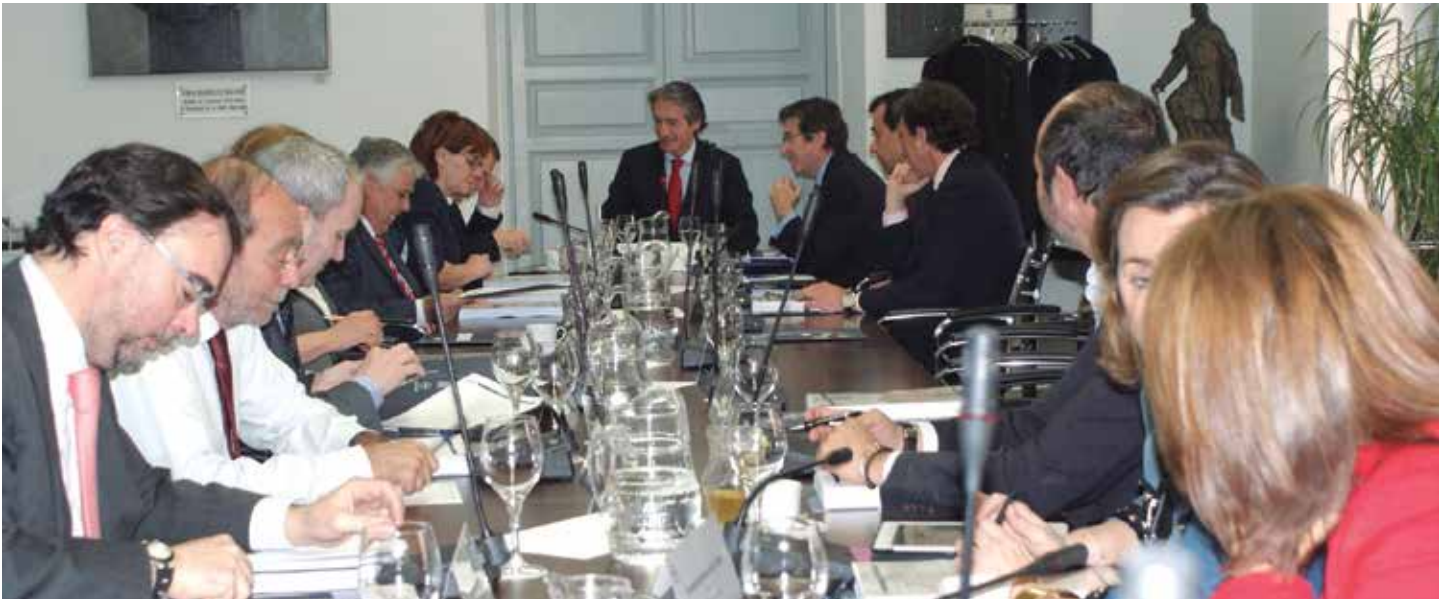
La última Junta de Gobierno ordinaria se celebró el 24 de marzo

Con todo ello, los participantes en el Pleno podrán serlo en calidad de delegados, observadores afiliados y observadores no afiliados. Los primeros acuden con voz y voto en representación de socios titulares. Los segundos, con voz pero sin voto, son miembros de Entidades Locales asociadas a la FEMP o también representantes de Federaciones Territoriales de Entidades Locales de ámbito autonómico asociadas a la FEMP. En cuanto a los terceros, que no tienen voz ni voto, son aquéllos que representan a Corporaciones Locales no asociadas, o de Federaciones de Entidades Locales de ámbito autonómico no vinculadas a la FEMP. ★