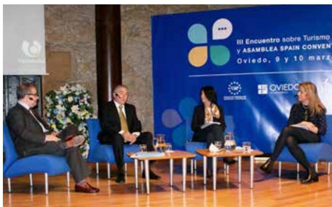
Una de las mesas de debate de la reunión de Oviedo.

turismo de reuniones", en concreto a las que integran el SCB, "que van a seguir trabajando decididamente para que sigamos siendo un destino puntero en el mundo".