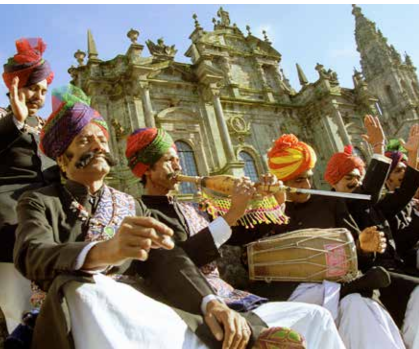
Fomentar la diversidad cultural y la convivencia ciudadana es uno de los objetivos de la Estrategia y, por tanto, del convenio suscrito.

El desarrollo de las acciones previstas en el convenio tendrán en cuenta la diversidad cultural y lingüística del Estado español y tratarán, al mismo tiempo, de mejorar el equilibrio territorial en el acceso a la cultura, tales como los destinados a la conmemoración de efemérides de relevancia cultural, los que tengan por objeto ampliar la difusión de los promovidos con este fin a otros territorios o la creación de rutas culturales, entre otros. ★