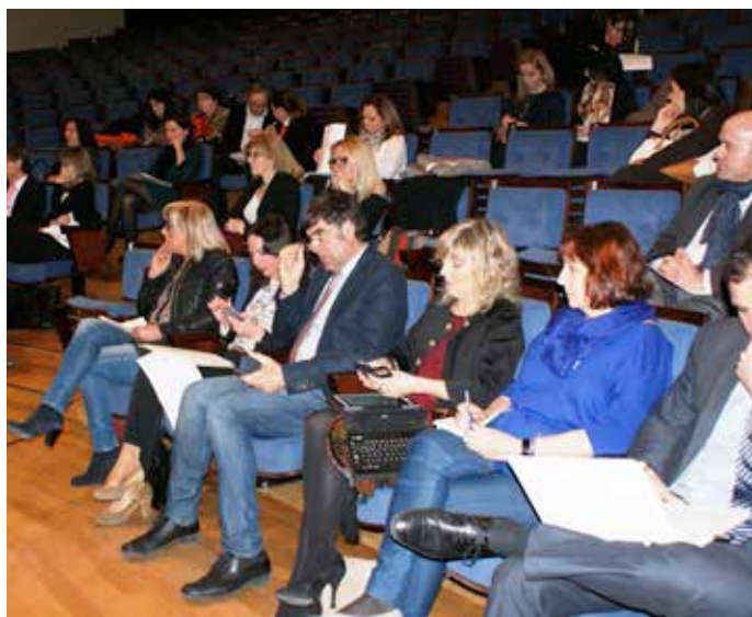
Al encuentro acudieron cerca de un centenar de profesionales del sector del turismo de reuniones (MICE).

También argumentó que el turismo de negocios da mucha riqueza al país y que "España debe mucho a las ciudades que invierten en