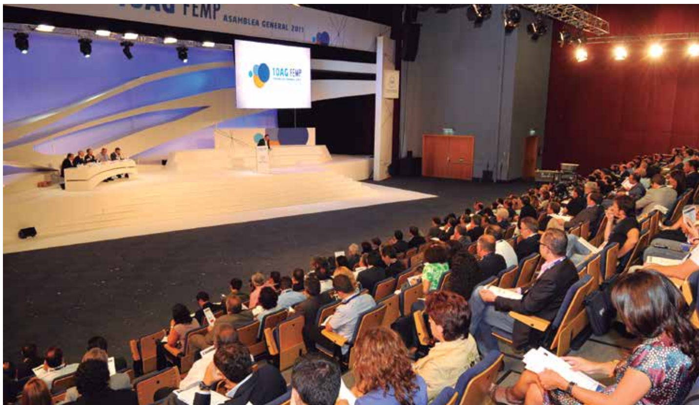
Plenario de la X Asamblea General, celebrada en 2011.

El Pleno es el órgano soberano de la Federación y se reúne, de forma ordinaria, una vez cada cuatro años. Es en este foro, al que están llamados a participar todos los miembros de la Federación, donde se diseña la "hoja de ruta" que marcará el trabajo a desarrollar durante el siguiente mandato de cuatro años y se determina la composición de los órganos de Gobierno de la FEMP (Consejo Territorial, Junta de Gobierno y Presidente) en función de la representación que las diferentes opciones políticas hayan obtenido en los municipios y provincias españoles.