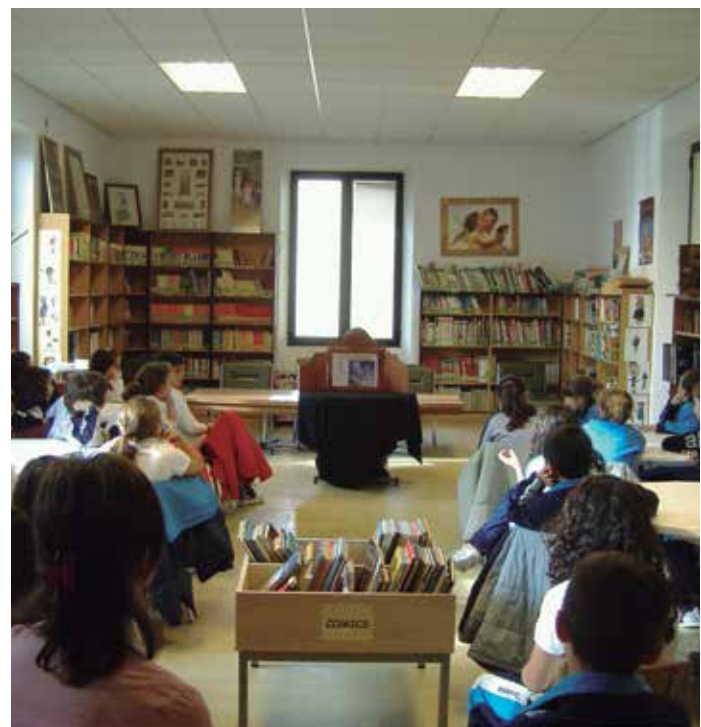
La FEMP quiere que se reconozca el inestimable papel de las bibliotecas municipales en el fomento de la lectura.

Desde la Federación se alude, además, a la participación de estos centros en las Campañas de Animación a la Lectura María Moliner que, en su última edición, concitó 609 proyectos elaborados y rea-