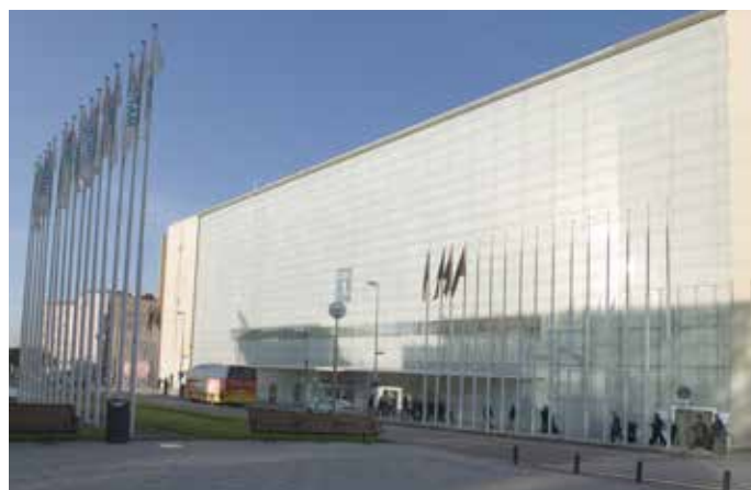
Palacio Municipal de Congresos de Madrid.

En cuanto al desarrollo del mismo, el Reglamento recoge el procedimiento de constitución de la Mesa así como las atribuciones y responsabilidades de ésta. El Pleno desarrollará sus funciones a través de las reuniones del Plenario y de las Comisiones de Trabajo que se constituyan en su caso para el debate sectorial de los asuntos incluidos en el Orden del Día correspondiente. Cada socio titular de la FEMP podrá solicitar su participación en las Comisiones de Trabajo que desee, comunicándolo oportunamente a la Secretaría General. No obstante, por razones técnicas podrá limitarse el número de participantes en cada Comisión. En ambos casos, la Junta de Gobierno establecerá el plazo y procedimiento de opción, que será remitido a los socios junto a la convocatoria del Pleno.